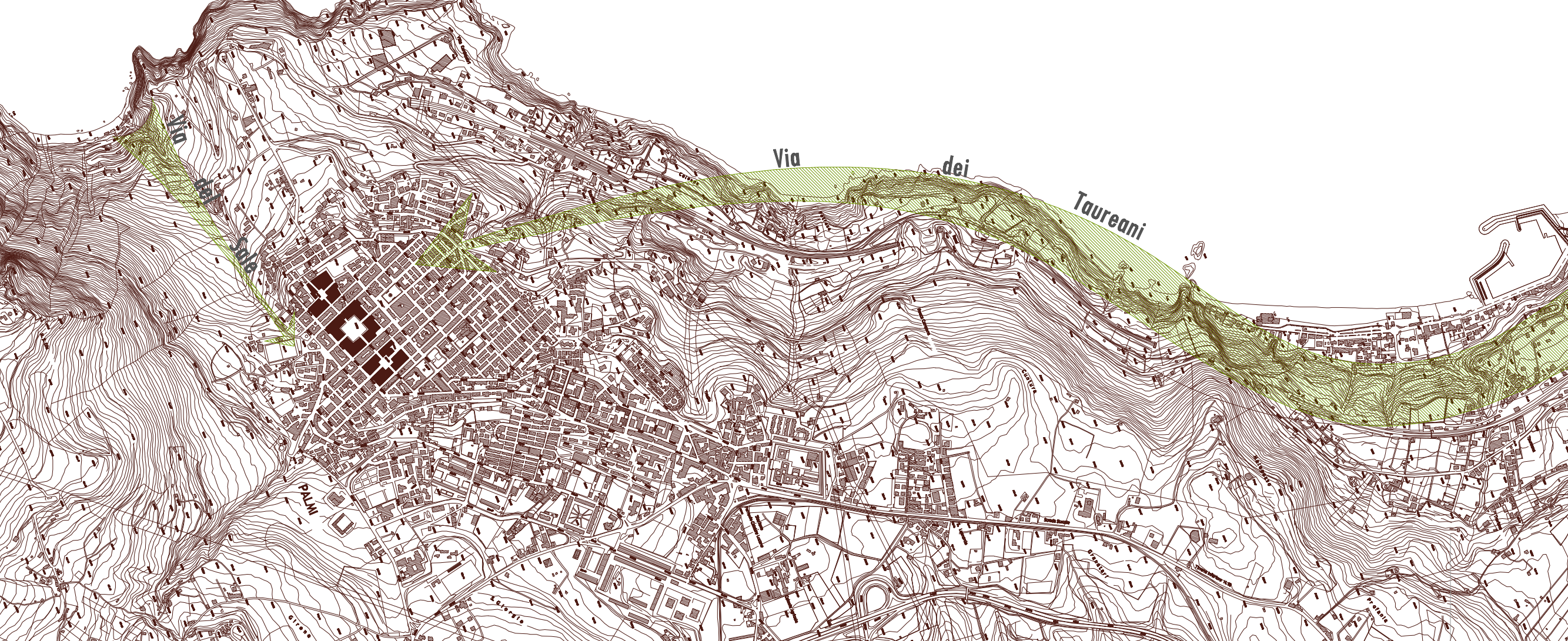
1.2 | Diagramma del Progetto Greenway